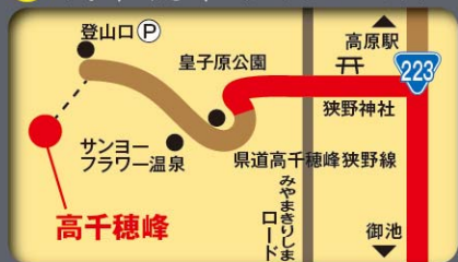
2 皇子原公園 (おうじばるこうえん)